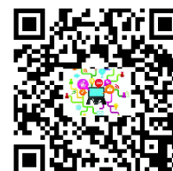
Nicolas, ingénieur en robotique