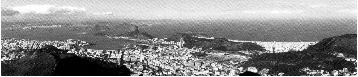
Figure 1 : Ville de Rio de Janeiro