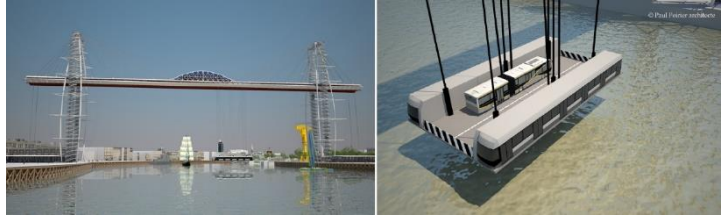
Figure 1 : projet de pont transbordeur à Nantes

Ce nouveau franchissement est envisagé dans une zone actuellement démunie de moyen de passage hormis une navette fluviale Navibus d'une capacité de 95 passagers et de 10 vélos.