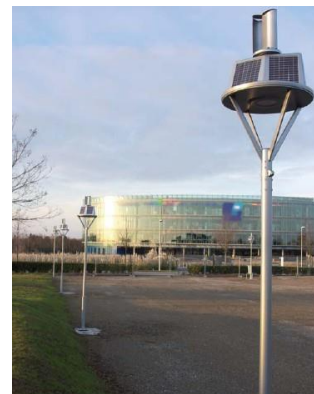
Figure 1 : luminaire Luméa