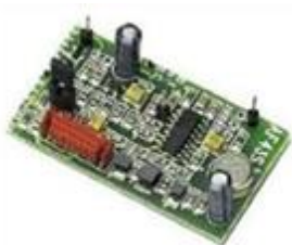
Figure 2 : carte électronique

Problématique : le luminaire Luméa a été conçu et fabriqué par l'entreprise Novéa Energies, basée à Beaucouzé (49). C'est une jeune entreprise innovante spécialisée dans la conception, la réalisation et la commercialisation de dispositifs d'éclairage public autonomes à basse consommation, respectueux de l'environnement tant sur le plan énergétique qu'esthétique. Afin d'optimiser la production de 250 unités de la carte électronique de gestion de l'énergie du lampadaire Luméa, il est nécessaire d'établir une planification des tâches d'industrialisation.